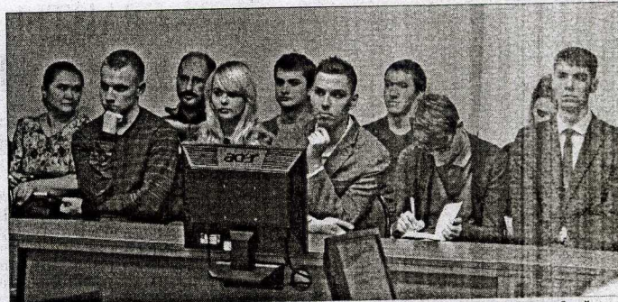
Обсуждение проблем современной молодежи собрало за круглым столом представителей нескольких поколений. Они очень различались в подходах, но шли к общей цели.